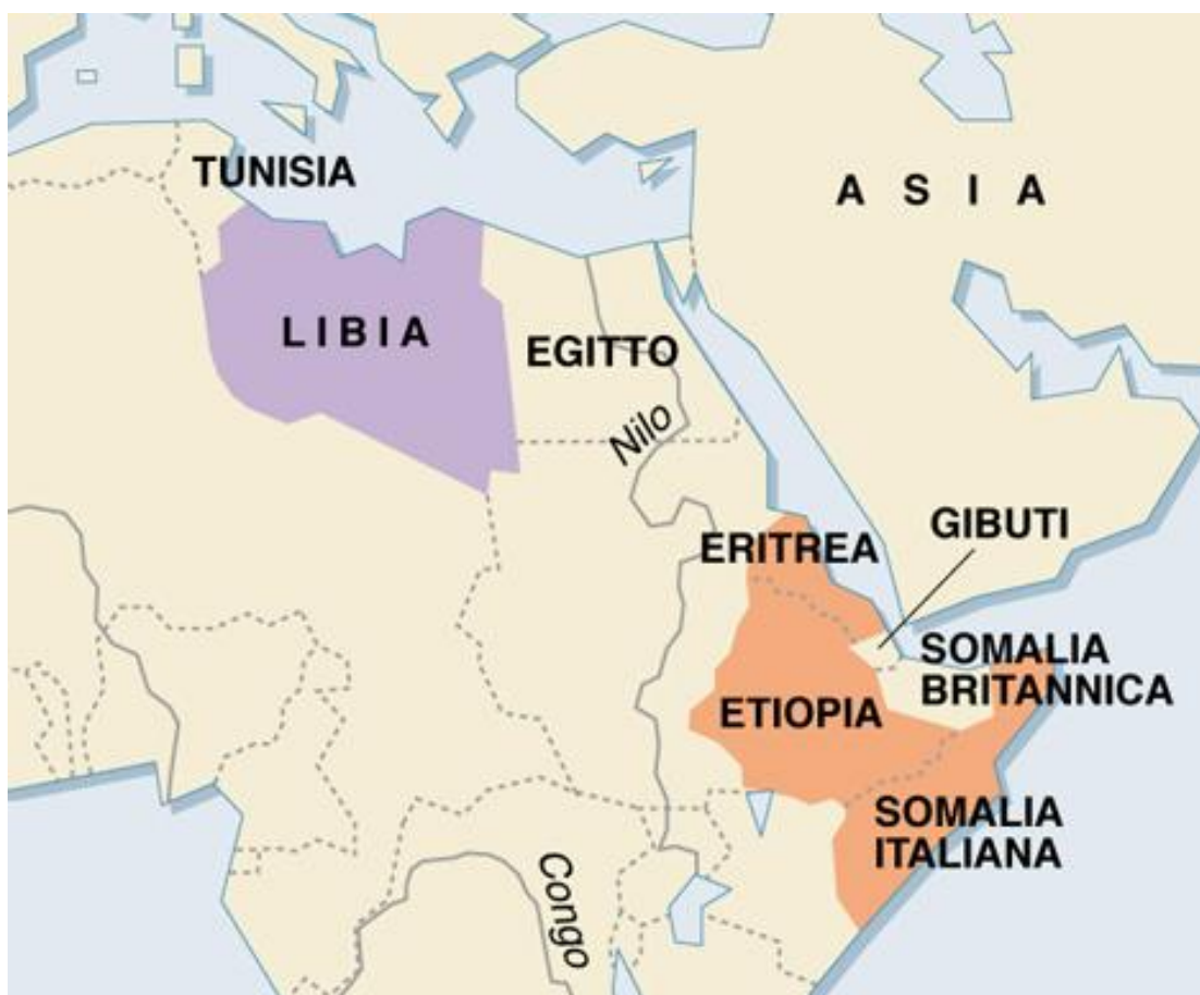
Impero coloniale fascista